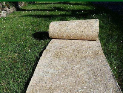
Rouleau de paillage idéal pour les plantations de talus