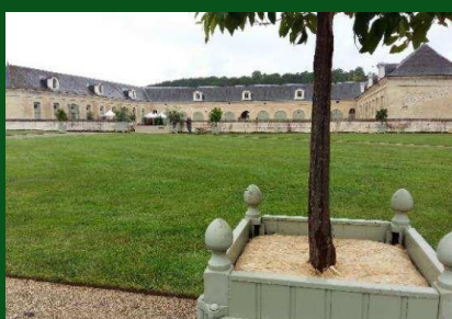
Dalle de paillage bac d'orangerie