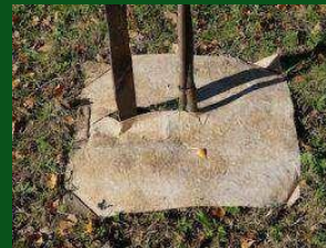
Dalle de paillage plantation